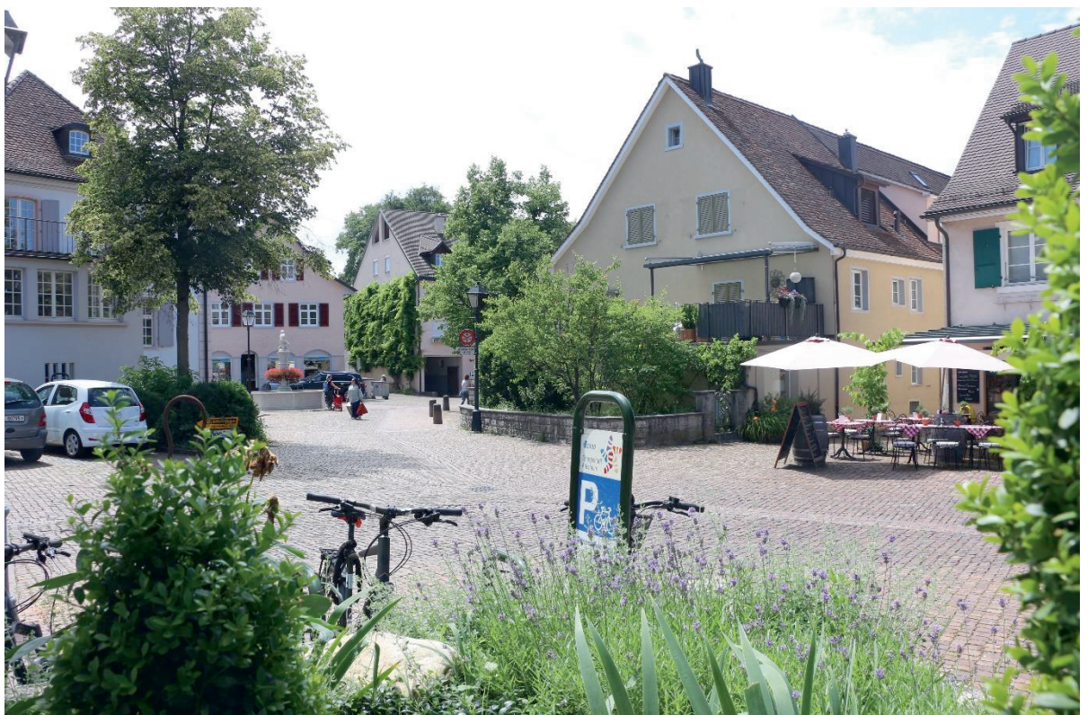
Abb. 3 Ortskern Arlesheim