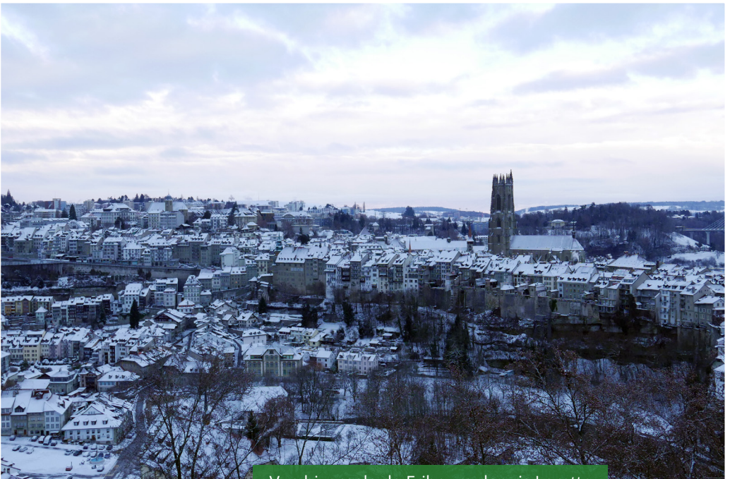
Vue hivernale de Fribourg depuis Lorette