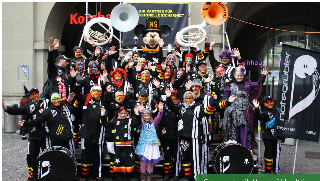
Guggenmusik Notegrübler Ittigen