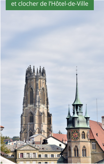
Cathédrale Saint-Nicolas et clocher de l'Hôtel-de-Ville