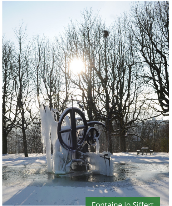
Fontaine Jo Siffert