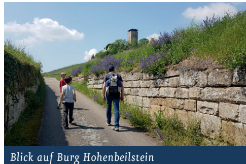
Blick auf Burg Hohenbeilstein

Die Wegbeschreibung beginnt am Parkplatz Burg Hohenbeilstein. Von dort aus geht es in die Weinberge den Hühbergweg hinauf, nach 100 m nach