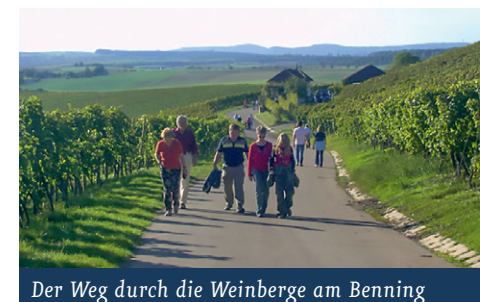
Der Weg durch die Weinberge am Benning

Diese Wegbeschreibung beginnt in Großbottwar bei der Kellerei der Bottwartaler Winzer, Oberstenfelder Str. 80. Neben dem Kellereigebäude befindet sich auf dem Parkplatz der Stand der Bottwartaler Winzer .