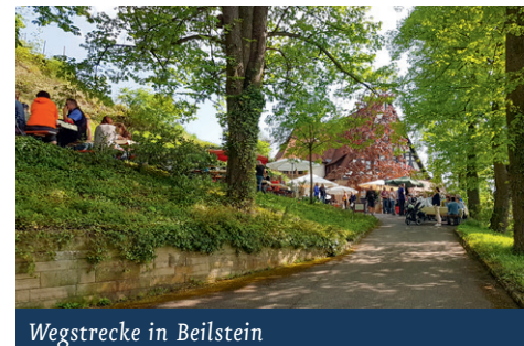
Wegstrecke in Beilstein

rotes Kreuz), geht rechts am Friedhof vor bei und weiter den Friedhof weg entlang bis zur Löwensteiner Straße. Linkerhand ist das ● Weingut Gemmrich. Auf der Löwensteiner Straße geht man zurück, nach rechts in die Hühbergstraße und bald nach links in die Burgunderstraße. Es geht durch das Wohngebiet am Spielplatz rechts in die Hebelstraße, rechts in die Hermann-Hesse-Str., rechts in die Justinus-Kerner-Straße, links in die Uhlandstraße und rechts in die Goethestraße. Dann folgt man beim Haus Goethestr. 12 der Treppe abwärts und überquert die Schmidhausener Straße, biegt ein in die Breslauer Straße und wandert dann die Berliner Straße leicht abwärts. Am Ende der Straße geht es kurz nach rechts, man überquert an der Fußgängerampel die Oberstenfelder Straße und weiter geht es im Forstbergweg. Er mündet in den Heerweg, dem man kurz nach links folgt. Danach wird gleich rechts nach „Im Köchersgrund“ eingebogen. Vorbei an Firmengebäuden und nach der Wegkreuzung geht es über freies-