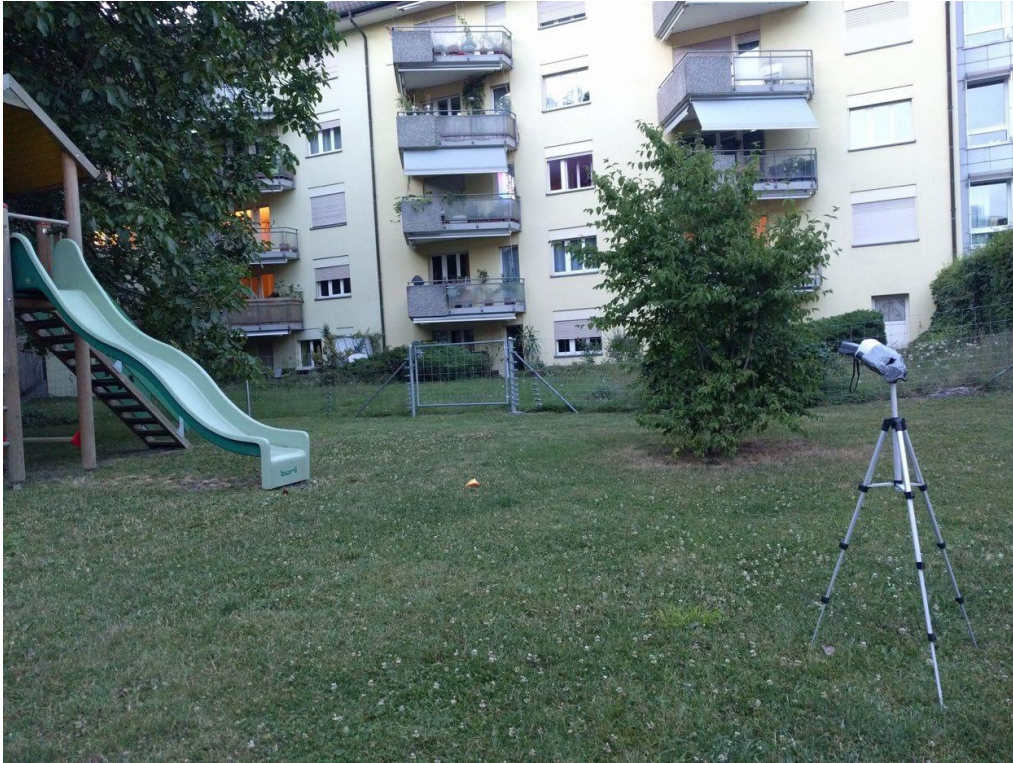
Mit der Unterstützung von Freiwilligen werden im Sommer 2024 an verschiedenen Orten im Siedlungsgebiet des Kantons Zug bioakustische Aufnahmen gemacht.