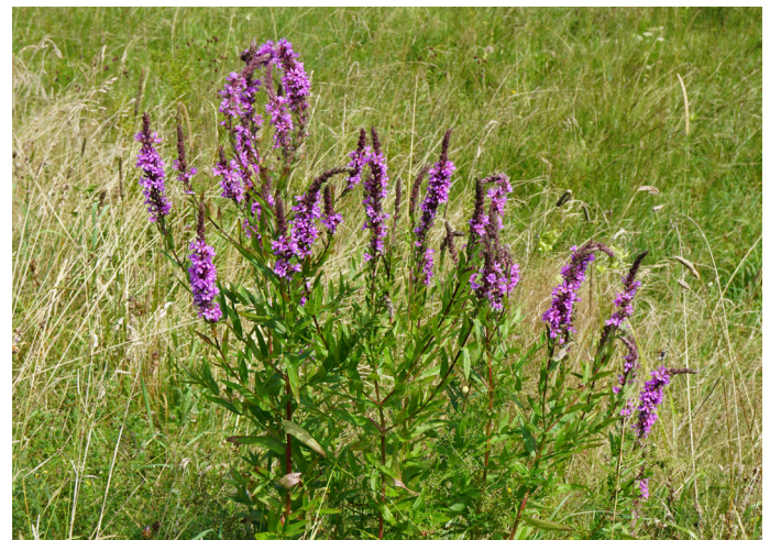
Blut-Weiderich Lythrum salicaria