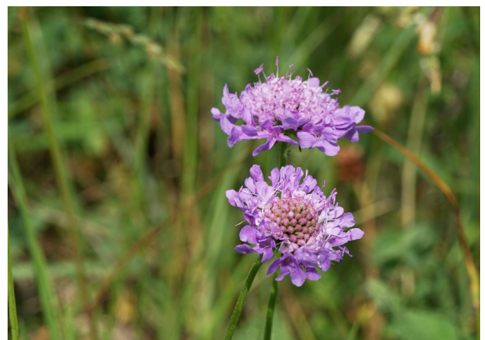
Tauben-Skabiose Scabiosa columbaria