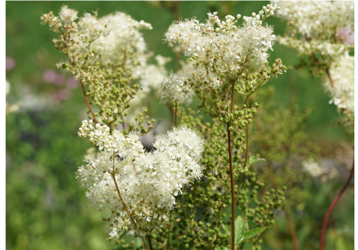
Echtes Mädesüss Filipendula ulmaria