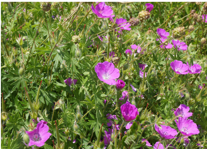
Blutröter Storchschnabel Geranium sanguineum