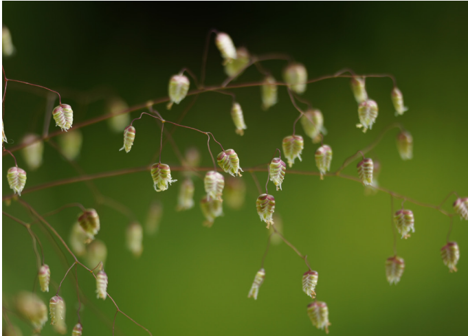
Mittleres Zittergras Briza media