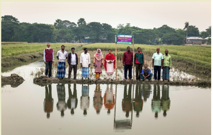
Die Organisation CCDB unterstützt besonders arme Familien in der Küstenregion bei der Anpassung an den Klimawandel.

Sie erhalten unter anderem salzresistentes Saatgut sowie Schulungen zu alternativen Anbautechniken, wie beispielsweise die schwimmenden, hängenden oder vertikalen Gärten. Außerdem werden sie bei der Errichtung von Regenwassertanks und Wasseraufbereitungsanlagen unterstützt. (BfdW)