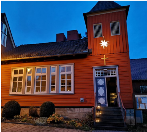
Kapelle Willensen im Advent („just friends“)

Die Willensener „just friends“ und die Löschgruppe laden ein, am 27.11.2021 ab 17.30 Uhr am Buswendepplatz in Willensen den Weihnachtsbaum gemeinsam zum Leuchten zu bringen. Von 18.00 Uhr bis 18.30 Uhr spielt der Posaunenchor. Für Essen und Trinken ist gesorgt, Tassen für Glühwein/ Kinderpunsch sind bitte mitzubringen. Es gilt die aktuelle niedersächsische Corona-Regelung.