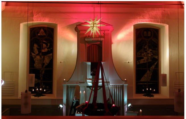
„Kirche in anderem Licht“

An den Sonntagen gibt es die Einladung, zwischen 18 und 19 Uhr in die Eisdorfer Kirche zu kommen, die „Kirche in anderem Licht“ zu erleben und dort einen Moment zur Ruhe zu kommen.