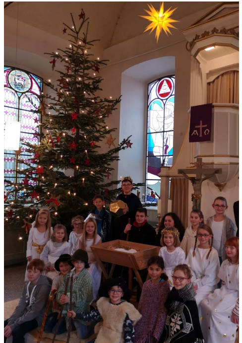
Krippenspiel 2018

Nachdem es im letzten Jahr einen Krippenspiel-Film zu sehen gab, ist dieses Jahr wieder die „Live-Aufführung“ des Krippenspiels an Heiligabend um 15.30 Uhr und am 2. Weihnachtstag um 18.00 Uhr in der St. Georgs-Kirche Eisdorf geplant.