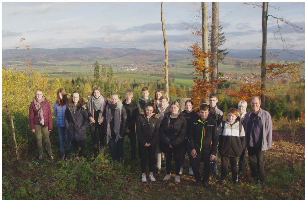
Konfirmationsjahrgang 2021 pflanzt Baum in Eisdorfer Kirchenforst

Am 6. November - bei schönstem Herbstwetter - haben sich die in diesem Jahr konfirmierten Jugendlichen des verbundenen Pfarramts Eisdorf/Willensen und Nienstedt/Förste getroffen, um gemeinsam einen Baum zu pflanzen.