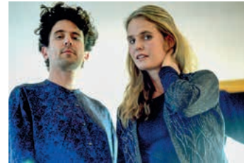
DOTA Songwriter Duo