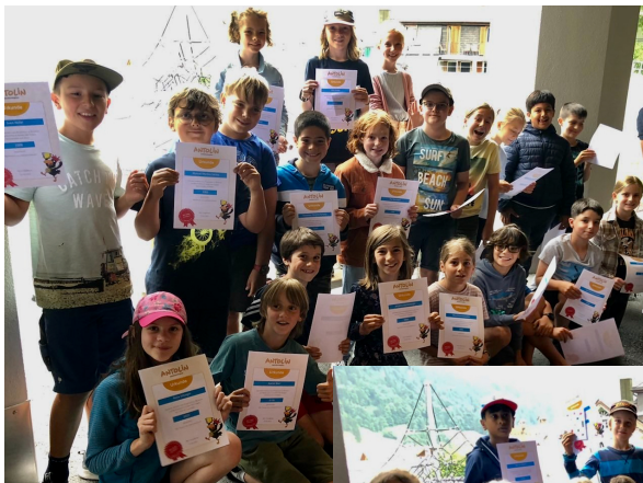
alle stolzen Mitglieder des "1'000er"-Clubs erhielten eine Urkunde

Allen Beteiligten herzlichen Dank für die Geduld, fürs Mitmachen, Mittragen, Mitleben und Weiterunterstützen im kommenden Jahr.