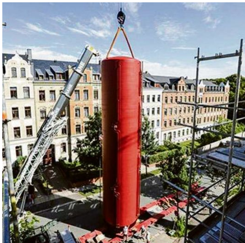
Thermische Speicher haben das Potenzial, Energiemangel zu überbrücken.

Die Verfügbarkeit von Sonnen- und Windenergie, aber auch der Wasserkraft ist abhängig von der Tages- und der Jahreszeit und wird vom Wetter beeinflusst. Im Sommer herrscht tendenziell ein Energieüberschuss, im Winterhalbjahr wird mehr Energie benötigt und die Verfügbarkeiten sind kleiner. Im Gegensatz zu fossilen Brennstoffen muss Sonnenenergie oder vorhandene Abwärme in thermischen Kurz- und Langzeitspeichern gelagert werden. So wird die zeitliche Diskrepanz zwischen Angebot und Nachfrage ausgeglichen. Dabei kommen unterschiedliche Formen der Speicherung zur