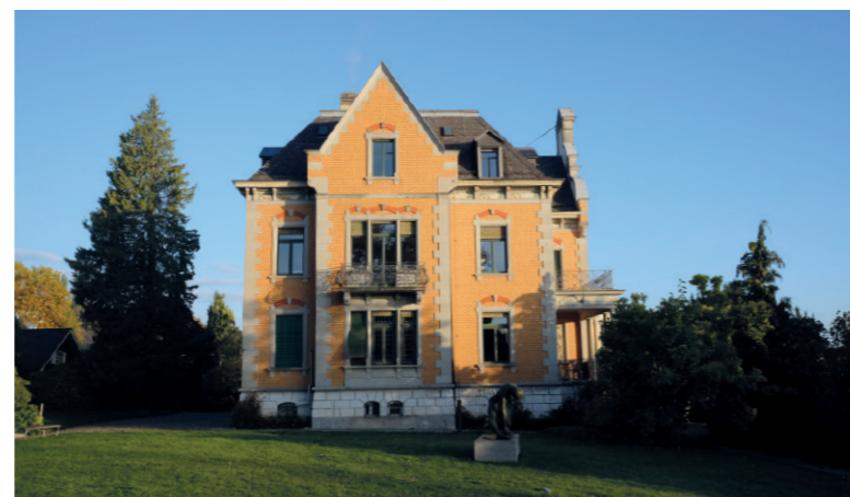
Die Ortsbibliothek bezieht neue Räume in der Villa Oetikergut.

Im Zuge des vergrösserten Angebots erweitert Estrina Stalder auch die Öffnungszeiten der Bibliothek und stockt das Personal auf. Vom neuen Angebot der Ortsbibliothek kann die Rüschtiker Bevölkerung ab Januar 2019 profitieren.