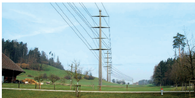
Der Gemeinderat Rüslikon wehrt sich gegen diese überdimensionierten Betonmasten im Erholungsgebiet.

Seit Kurzem liegt nun das Resultat der langjährigen Abklärungen vor: das BFE hat die Genehmigung für den Bau der 132kV Bahnstromleitung und der 380kV Hochspannungsleitung als Freileitung wieder erteilt.