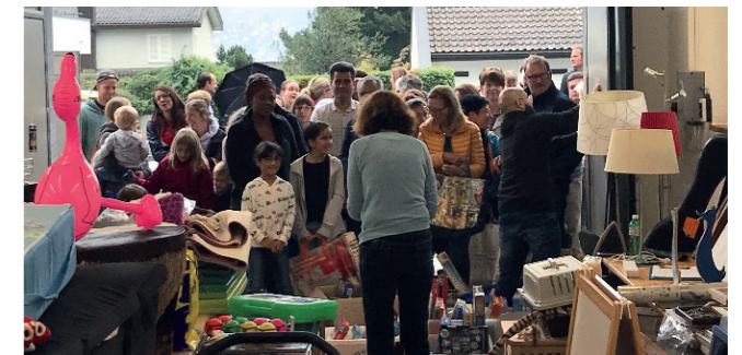
Grosser Andrang am 1. Rüslikler Bring- und Holtreff