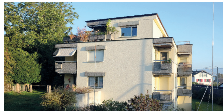
An der Schönenstrasse 46 ist ein Neubau geplant.

Die Stiftung bietet für Rüslikler Verhältnisse preisgünstige Wohnungen an. Dies ist möglich dank einer Beschränkung der Zimmergrössen und klaren Belegungsvorschriften. Einkommensschwache Haushalte können zusätzlich Unterstützung aus dem Solidaritätsfonds beantragen: Übersteigt der Mietzins 35% des in der Steuererklärung dokumentierten Bruttoeinkommens, kann bei der Stiftung jährlich eine Mietzinsreduktion beantragt werden. Andererseits können Besserverdienende in ihren Wohnungen bleiben – einfach zum höheren Mietzins. Dieses mit dem Mietrecht in Einklang stehende Modell ist derzeit schweizweit (noch) einzigartig.