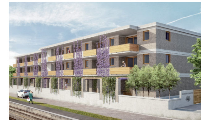
So schön wird die Alterswohnsiedlung «im Weingarten».

Heute hält die gemeindenahe Stiftung in zehn Mehrfamilienhäusern insgesamt über 100 Wohnungen in ihrem Portefeuille. Neu dazu kommt im nächsten Frühling die Siedlung «im Weingarten». Dort werden derzeit 21 Alterswohnungen an zentraler Lage am Bahnweg 6 und 8 gebaut, die ab April 2019 bezugsfertig sind. Mit dem attraktiven Neubau leistet die Stiftung einen wichtigen Beitrag zur Abdeckung der Nachfrage nach Alterswohnungen in Rüslikon. Die Alterswohnungen schlagen eine Brücke für ältere Menschen, die weiterhin selbstständig wohnen möchten, gleichzeitig aber nach Bedarf zusätzliche Dienstleistungen wünschen. Auch für die Alterswohnungen können finanziell benachteiligte Mieter Unterstützung aus dem Solidaritätsfonds beantragen.