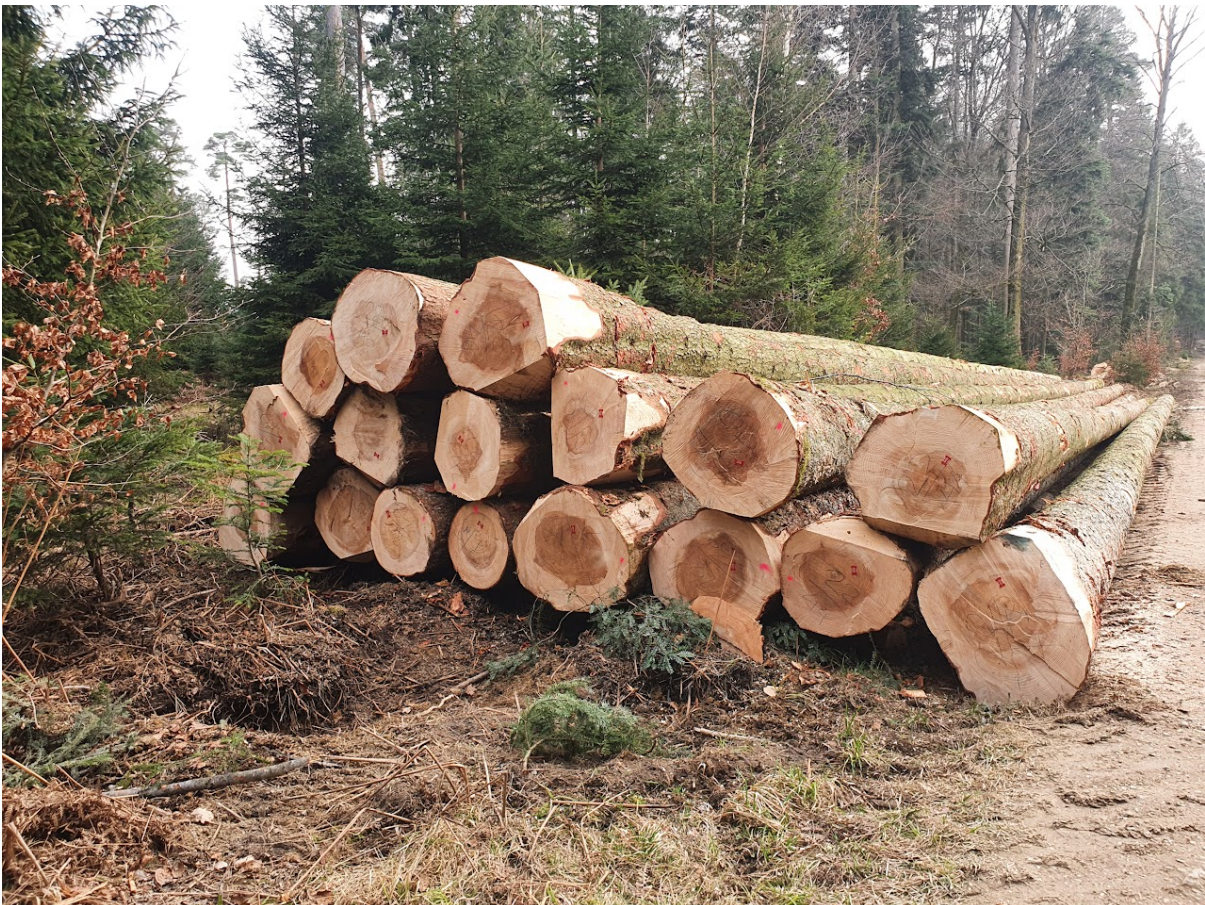
Schweizer Holz ist gefragt. Die Preise sind stabil.