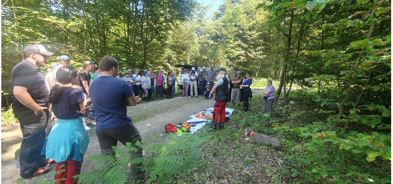
Am Waldumgang Siglistorf wurde die Bedeutung von Wild und Jagd präsentiert.

2023 hat der Forstbetrieb über verschiedenen Medien über das aktuelle Forstgeschehen informiert. In Ehrendingen, Siglistorf und Bad Zurzach haben Anlässe mit den Schulen stattgefunden. In Mellikon, Siglistorf und Bad Zurzach wurden gut besuchte Waldumgänge mit der Bevölkerung durchgeführt. Zusätzlich war der Forstbetrieb in Zurzach am Weihnachtsmarkt beteiligt.