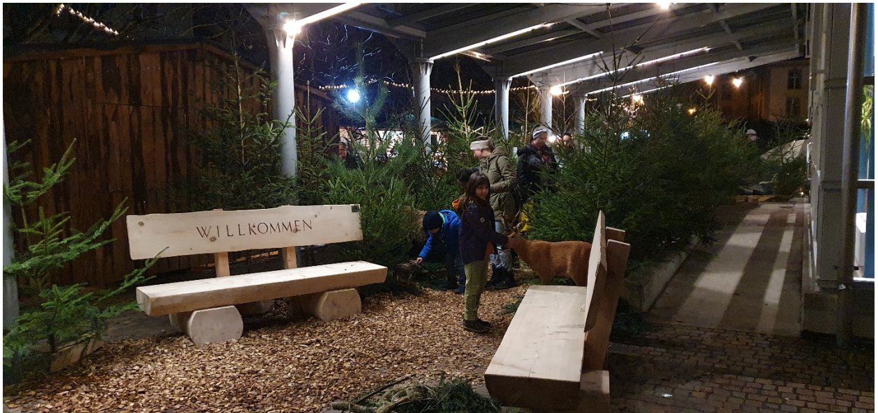
Der Forstbetrieb hat zusammen mit den Ortsbürgern am Weihnachtsmarkt Zurzach teilgenommen.