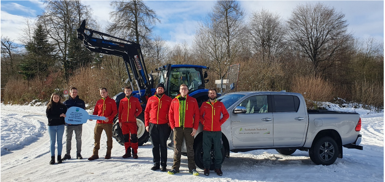
Am 5. Dezember 2023 wurden dem Forstteam der neue Pick-up und gleichzeitig der für 2024 vorgesehene Forstraktor übergeben.