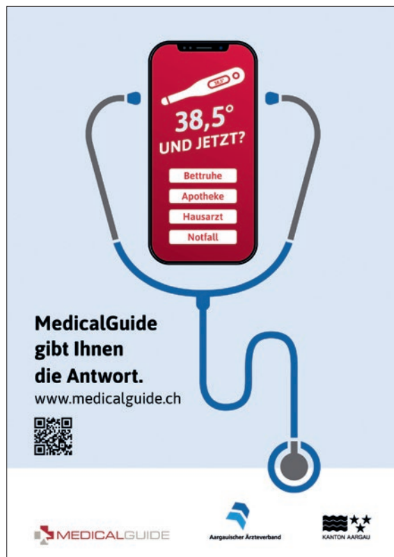
Abbildung 3: Ein nationales Kommunikationspaket steht bereit.

land wird das Ersteinschätzungsinstrument seit zwei Jahren im Notfalldienst der niedergelassenen Ärzteschaft bundesweit eingesetzt. Allein in diesem Anwendungsbereich werden täglich 4000 bis 5000 Ersteinschätzungen durchgeführt. Die Rückmeldungen der medizinischen Fachpersonen zu den medizinischen Inhalten und der Software fließen in den für Medizinprodukte verpflichtenden Post-Market-Surveillance-Prozess und in die Weiterentwicklung von «MedicalGuide» ein. In Zusammenarbeit mit dem