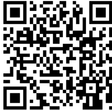
QR-Code Meine Umwelt-App

Weitere Informationen zur Asiatischen Hornisse und wie sich die Art von heimischen Insekten unterscheiden lässt finden sich auf der Homepage der LUBW https://www.lubw.baden-wuerttemberg.de/natur-und-landschaft/asiatische-hornisse sowie auf der Homepage der Landesanstalt für Bienenkunde der Universität Hohenheim unter https://bienenkunde.uni-hohenheim.de/vespavelutina . Dort finden sich auch weitere Informationen, wie Bürgerinnen und Bürger aktiv bei der Suche nach Tieren und Nestern mitwirken können. Seit April 2024 koordiniert die Landesanstalt für Bienenkunde in Stuttgart-Hohenheim im Auftrag der Naturschutzverwaltung das landesweite Management der Asiatischen Hornisse (Kontakt siehe Homepage).