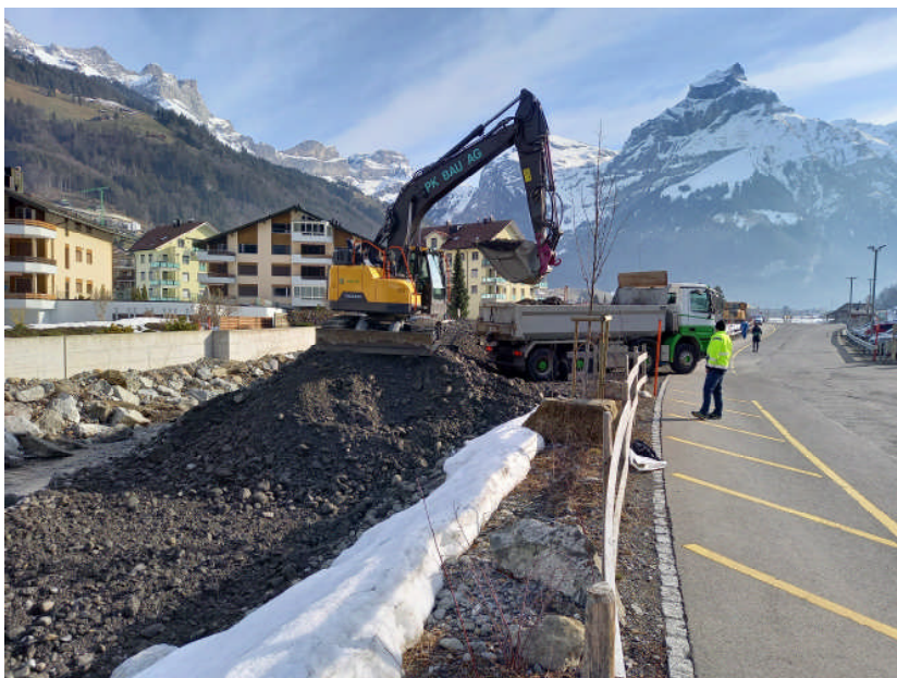
Abbildung 3: Auflad von den Auflandungen im Bereich oberhalb des Fassungswehrs Eugenisee.

Sollten Sie sich gewundert haben, wieso Anfangs März ein Bagger im Bereich der Talstation der Titlisbahnen im Einsatz gestanden hat, so lässt sich dies mit den festgestellten Ablagerungen im Gerinne begründen. Aufgrund der Flachstrecke im Bereich der Talstation sowie dem Einfluss des Wehrs beim Eugenisee hat sich in den letzten Jahren das durch die Engelberger Aa transportierte Geschiebe in diesem Bereich abgelagert. In Anbetracht der Einschränkung der Hochwassersicherheit und der Fertigstellung des Geschiebeablagerungsraums ist nun der Zeitpunkt gekommen um die Auflandungen aus dem Gerinne zu entfernen. Um solche Eingriffe in der Zukunft verhindern zu können, bemüht sich die Gemeinde darum, dass die Realisierung des Wehrrumbaus beim Eugenisee (liegt in der Verantwortung von ewl und Kanton Obwalden) möglichst bald erfolgen wird. Dieser Umbau ist zwingend notwendig, damit sowohl die Hochwassersicherheit gegeben ist als auch die Geschiebedurchgängigkeit funktioniert.