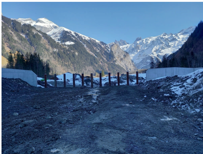
Abbildung 1: Blick auf den fertiggestellten Holzrückhalt im Bannwald (Blick gegen die Fliessrichtung).

In den nächsten Monaten wird nun im Bannwald der Aushub des Ablagerungsraums weiter vorangetrieben, damit bis ca. Ende Juli ein weiterer Meilenstein des Projekts erreicht sein wird. Mit dem Abschluss der Hauptarbeiten am Geschiebeablagerungsraum im Bannwald wird ab diesem Sommer während Hochwasserereignissen das durch die Engelberger Aa transportierte Geschiebe und Schwemmholz im Bannwald abgelagert und zurückgehalten. Die Wahrscheinlichkeit von Geschiebeablagerungen oder Brückenverklausungen (Verstopfungen mit Schwemmholz) im Bereich des Siedlungsgebiets und damit das Risiko der in der Vergangenheit öfters festgestellten Wasseraustritte aus der Engelberger Aa werden stark vermindert.